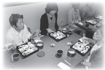
昼食交流会でわいわい

また、当日は神の園や役場、社協職員も同行していますので、気軽に悩み相談や介護の方法について相談できます。