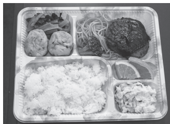
ボランティアさんの手作りお弁当

※外出などで一時的に取り消す 場合は、2日前までに社協地域福 祉課まで連絡してください。(連 絡がなかった場合は、有料キャン セルとなります。)