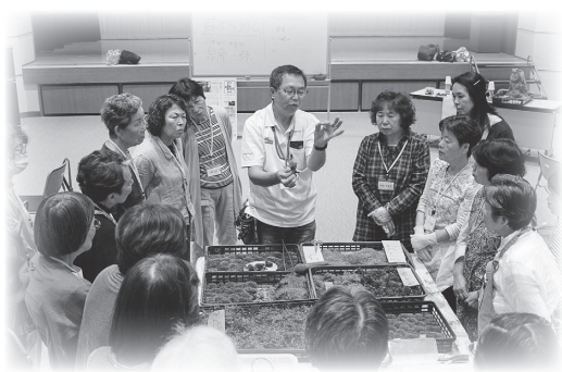
外出や講師の方が来ての体験活動