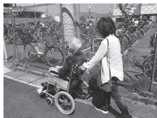
車いすでの通院付添の様子